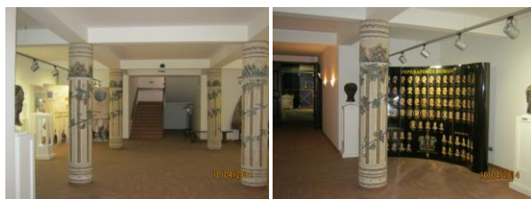
VIMINACIJUM Rimski vojni logor i grad